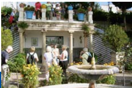
Utflukt til fjellbyen Ronda. Her var det masse fint å se på.