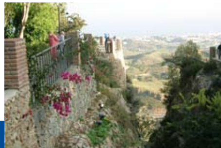
Utsikt fra fjellbyen Ronda som bærer tilnavnet «Tyrefektingens vugge». En over hundre meter dyp kløft deler byen i to.