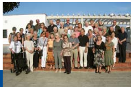
Her ser vi alle de glade turdeltagerne.

Kundeturen vi pleier å arrangere ble en nok en gang en suksess. Denne gangen reiste vi til Andalucia og det ble en begivenhetsrik og interessant tur for de som ble med. Neste gang arrangerer vi to kundeturer. Du kan enten bli med til Lofoten i august eller til Cuba i november. Nærmere opplysninger blir lagt ut på hjemmesiden, og i bankens lokaler.