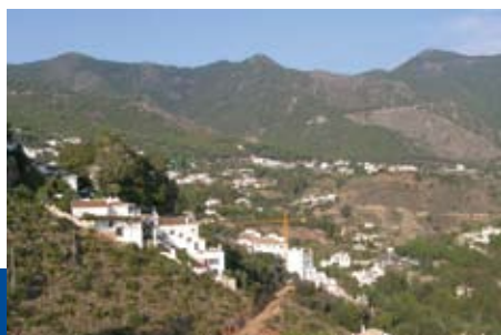
Andalucia er kjent for «Pueblos blancos» som betyr hvite landsbyer. Her ser vi landsbyen Mijas.